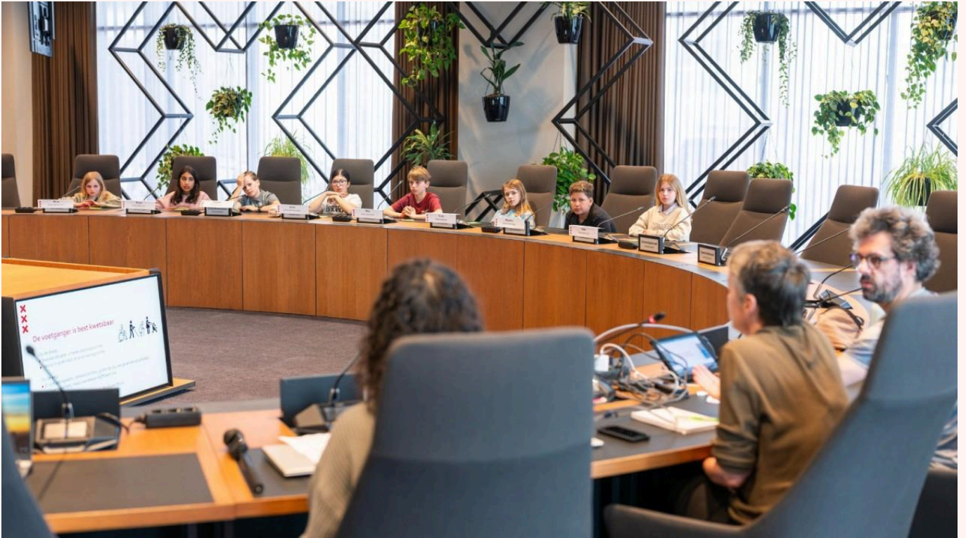
Amsterdamse Kinderraad; Foto door Tom Baas