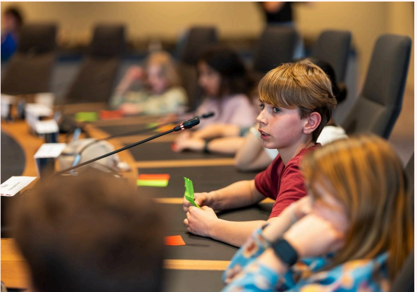
Amsterdamse Kinderraad

In deze samenwerking speelt Designathon Works een belangrijke rol. Zij begeleiden de kinderen tijdens Designathon workshops waarin zij ideeën bedenken en prototypes bouwen. Zo worden de kinderen actief betrokken als mede-ontwerpers van hun stad.